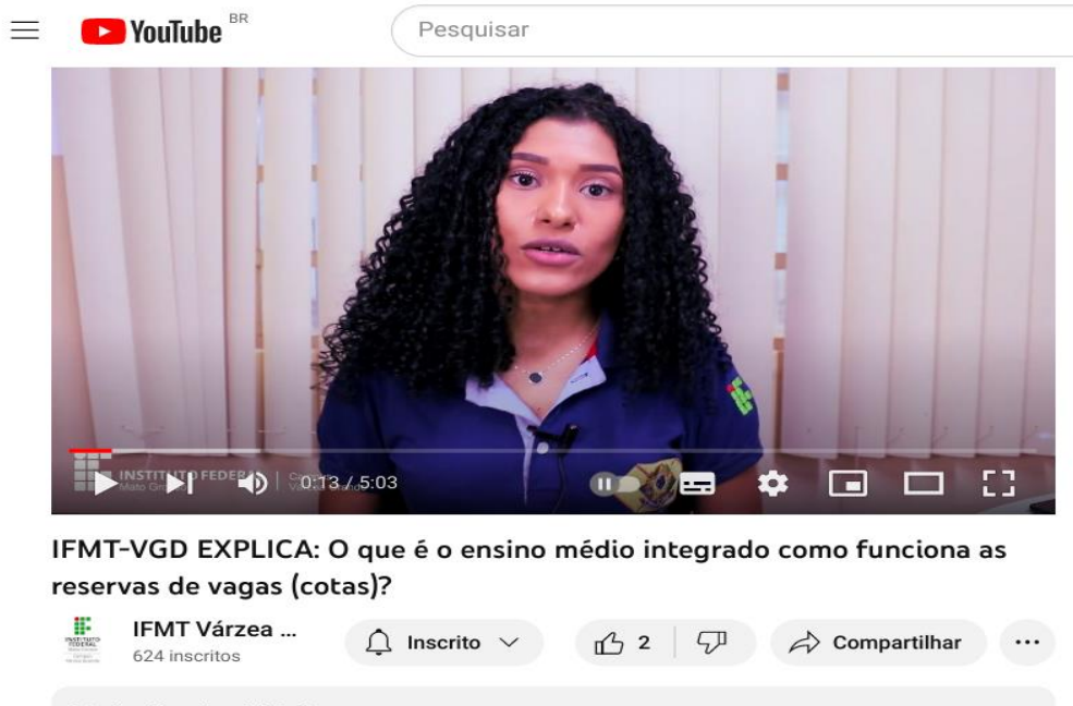
Figura 2 - Plataforma YouTube: Video IFMT-VGD EXPLICA: O que é o Ensino Médio Integrado e como funciona o processo de reserva de vagas (Cotas)