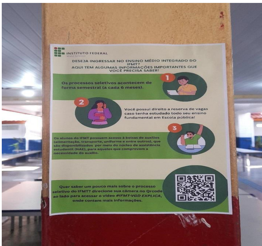
Fotografia 1 – Folder colado no corredor da escola José Mendes Mar